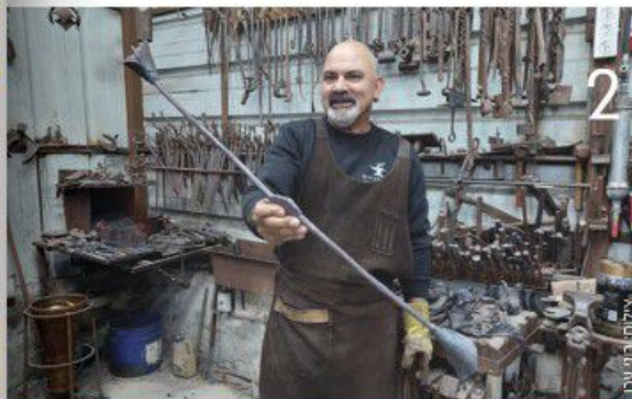
2 | ואלד חורי