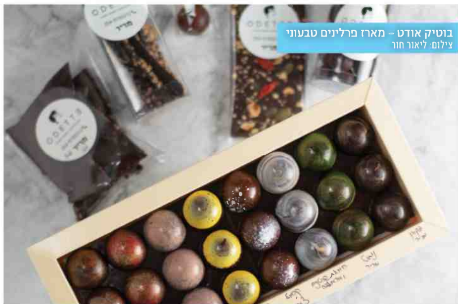
בוטיק אודט - מארז פרלינים טבעוני