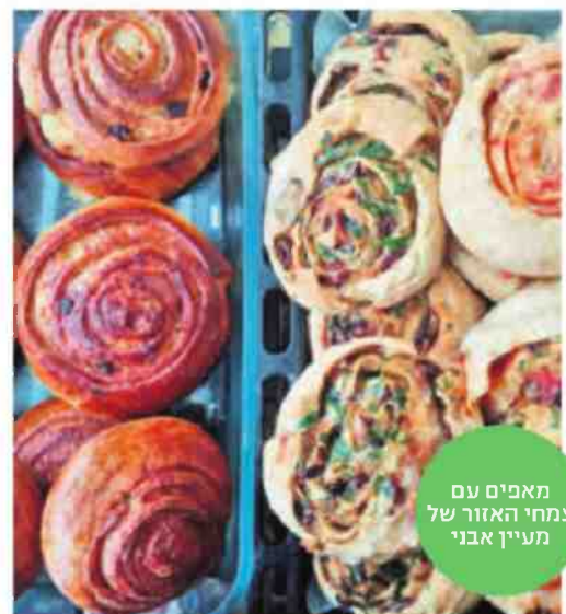
מאפים עם צמחי האזור של מעין אבני