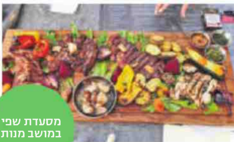
מסעדת שפי במושב מנות

אנגוס 300 גרם - 165 שקל. אפשר להזמין ספיישל זוגי כ-200 שקל לסועד, שכולל המבורגר, צ'יפס, חמוצים של שפי, פלטת בשר מעושן ושתי בירות. יש סלטים מעולים כמי-נות ראשונות - חציל מהטאבון, טא-בולה, מחבת פטריות, ובוצ'ר בשרים, פרגית וסטייק. הנוף בחינם. המסעדה פתוחה כל יום החל מ-18:00, וביום שישי מהבוקר. טלפון: 052-6487800.