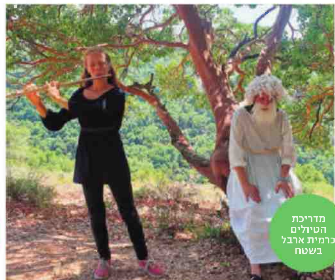
מדריכים הטיולים כרמית ארבל בשטח