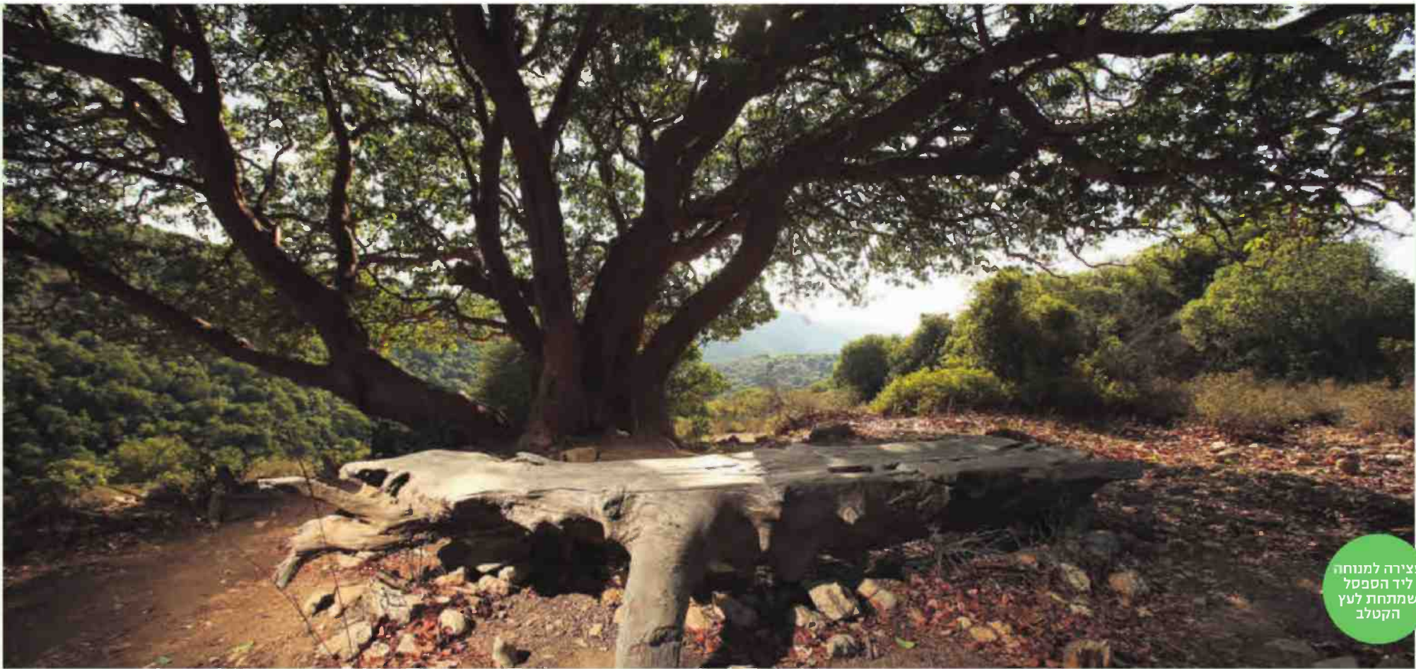
עצירה למנוחה ליד הספסל שמתחת לעץ הקטלב