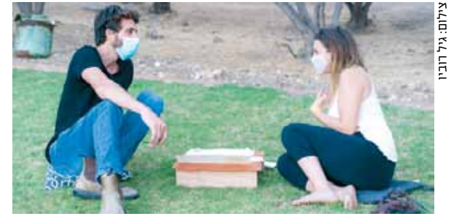
צומח לב. מוזיקה, אקרו יוגה, סדנאות רישום בטנץ, מדיטציה מונחית ועוד

פסטיבל "מקודשת" שמתקיים בירושלים זה עשור עוסק באמנות רבת-חומית - בעיקר שילובים יצירתיים בין מוזיקה, ספורט, מיצבים, תחושה חזקה של מקומיות ישראלית וירושלמית ופתיחות גדולה לעולם שבחוץ - משאמאנים טיבטיים ועד מוזיקה יהודית-ארמנית. עוד לפני התפרצות המגפה, החליטו מארגני הפסטיבל להתמקד השנה בהתארגנות לקראת