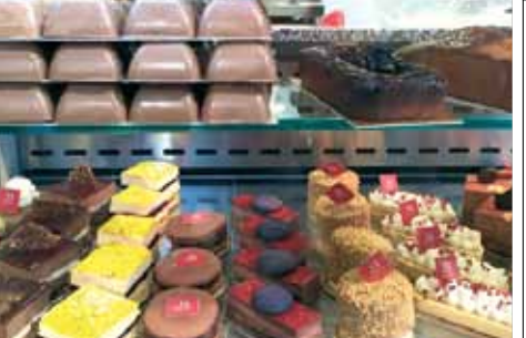
נתניה. מפטיסרי ועד לנורי