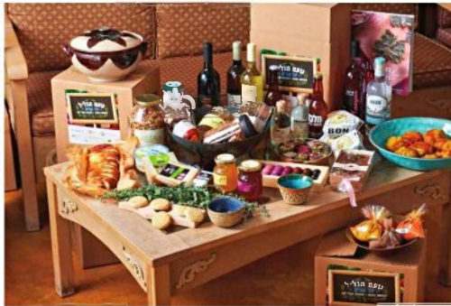
מגיעים עד הבית. יריד טעם הגליל

יריד טעם הגליל שמפיקה עמותת "זמן גליל מערבי" לא יוכל להתקיים השנה במתכונת ההמונית הרגילה, אך עשרות היצרנים המשתתפים מדי שנה לא חשבו אפילו לרגע לוותר ויקיימו גם השנה את האירוע במשלוח עד הבית לכל חלקי הארץ. מאות מוצריים של עשרות אמנים, בשלנים ויצרנים גליליים מחכים באתר של עמותת "זמן גליל מערבי", וייארו ויישלחו עד בית המזמין לאחר ביצוע ההזמנה. במיוחד לקראת שבועות, נוצרו שלושה מארזים מיוחדים וחד-פעמיים, הכוללים מגוון של יינות מארבעת יקבי הכוטיק החברים בעמותה (כישור, יפתחאל, שטרן ולטם), גבינות של מחלבת אלטו ושירת רועים ומאפים מיוחדים לחג, הכל תוצרת מקומית גלילית. לכל משלוח יצורף גם עציץ תבלין קטן מהגליל וחוברת מתכונים של חברי העמותה – מתנה.