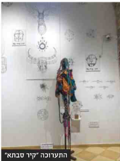
התערוכה "קיר סבתא"