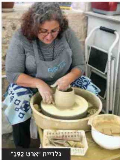
גלריית "ארט 192"